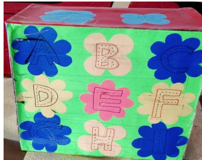
Gambar 5. Media Kotak Huruf.