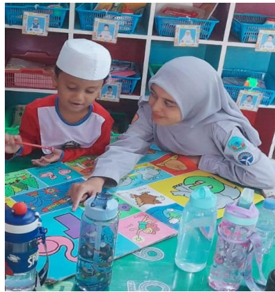
Gambar 6. Kegiatan Membaca Anak.

Melalui hasil wawancara setiap sekolah memiliki karakteristik anak yang berbeda dalam kemampuannya. Kemampuan membaca permulaan anak di TKIT Pelita Doktera terdapat satu anak yang bisa membaca, tetapi seluruh anak sudah mengetahui huruf. Kemudian kemampuan anak di TK Islam Al Falah terdapat 4 anak yang sudah bisa membaca, namun seluruh anak yang sudah mengetahui huruf. Kemudian kemampuan anak di TK Rizani Putra terdapat 4 anak yang sudah bisa membaca, namun seluruh anak sudah mengetahui huruf. Tujuan dari kemampuan membaca permulaan anak yaitu untuk mengembangkan aspek perkembangan anak.