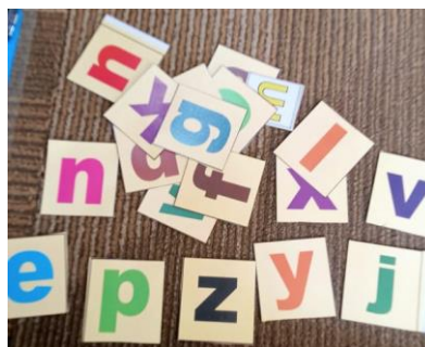
Gambar 3. Media Kartu Huruf.