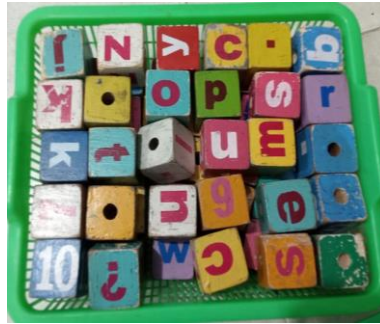
Gambar 4. Media Balok Huruf.