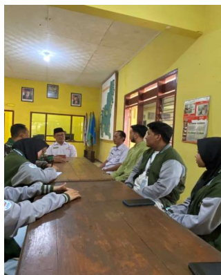
Gambar 3 Sosialisasi Kegiatan Digitalisasi UMKM Berbasis Website

Sosialisasi terkait kegiatan pengabdian bertujuan untuk menginformasikan kepada mitra pengabdian tentang pelaksanaan kegiatan, termasuk waktu dan jadwal yang akan berlangsung selama dua minggu. Kegiatan yang dilaksanakan mencakup penghimpunan data profil desa, penataran penggunaan website, serta penataran dan asistensi lainnya. Sosialisasi ini dilakukan di kantor desa mitra, yaitu Desa Karanglo, selama satu hari. Acara tersebut dihadiri oleh aparat desa, tim pelaksana pengabdian, serta dosen pembimbing lapangan. Tahapan awal kegiatan diawali dengan introduksi program pengabdian. Peserta yang hadir dan terlibat meliputi perangkat desa Karanglo, yang terdiri dari Kepala Desa, Kepala Dusun, serta staf, bersama dengan pengurus inti dari tim pelaksana dan dosen pembimbing lapangan. Sosialisasi kegiatan digitalisasi UMKM berbasis website memberikan banyak manfaat bagi pelaku usaha kecil dan menengah. Dengan adanya sosialisasi ini, UMKM dapat memahami pentingnya penggunaan website sebagai sarana untuk memperluas jangkauan pasar, meningkatkan visibilitas produk, serta mempermudah akses pelanggan terhadap informasi usaha. Selain itu, digitalisasi juga membantu UMKM meningkatkan efisiensi operasional dan daya saing di era teknologi. Melalui penataran dan asistensi yang diberikan, pelaku UMKM diharapkan mampu memanfaatkan teknologi secara optimal untuk mendukung pertumbuhan bisnis mereka.