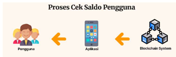
Gambar 5 Proses Cek Saldo dan Topup

Apabila pengguna tidak memiliki saldo yang cukup, maka tampilan error akan muncul pada perangkat pembayaran. Sehingga pengguna perlu melakukan topup pembayaran. Proses topup pembayaran dilakukan pada gambar 5, semua proses pembayaran telah melewati system blockchain, sehingga keamanan menjadi lebih terjamin.