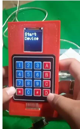
Gambar 2 Perangkat Pembayaran Berbasis IoT

Pelaksanaan pengabdian di TeFa Jurusan Teknologi Informasi ini dilakukan diskusi dengan direktur TeFa secara langsung. Penggunaan teknologi Blockchain diharapkan dapat membantu system pembayaran digital yang telah ada menjadi penguat dan pengaman dalam proses transaksi elektronik. Pada proses implementasi perangkat keras yang ditunjukkan pada gambar 2 merupakan prototype yang masih terus dilakukan penyempurnaan untuk mendapatkan hasil dan pengalaman pengguna yang lebih baik.