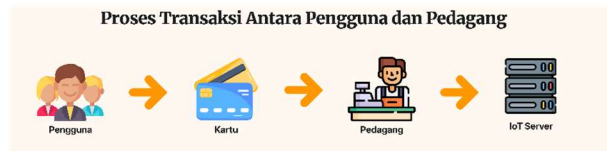
Gambar 3 Proses Transaksi Pedagang dan Pembeli

Proses pertukaran informasi yang telah dimasukkan oleh pedagang lalu akan diolah pada blockchain system , proses ini ditunjukkan pada gambar 4, dimana data yang telah ditangkap oleh IoT server akan dilanjutkan pada blockchain system, apabila data telah valid maka akan disimpan pada database.