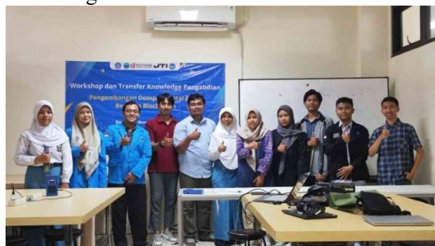
Gambar 6 Kegiatan Workshop Transfer Ilmu Pengetahuan

Selain pembuatan prototype kami juga melakukan sesi workshop berupa transfer ilmu pengetahuan bersama mahasiswa dan tim TEFA JTI, seperti yang ditunjukkan pada gambar 6. Pada acara ini peserta tampak antusias, bahkan terdapat siswa yang berasal dari SMAN1 Jember yang sedang mengikuti lomba terkait blockchain . Sehingga dating menghadiri workshop yang diselenggarakan bersama TEFA JTI Politeknik Negeri Jember.