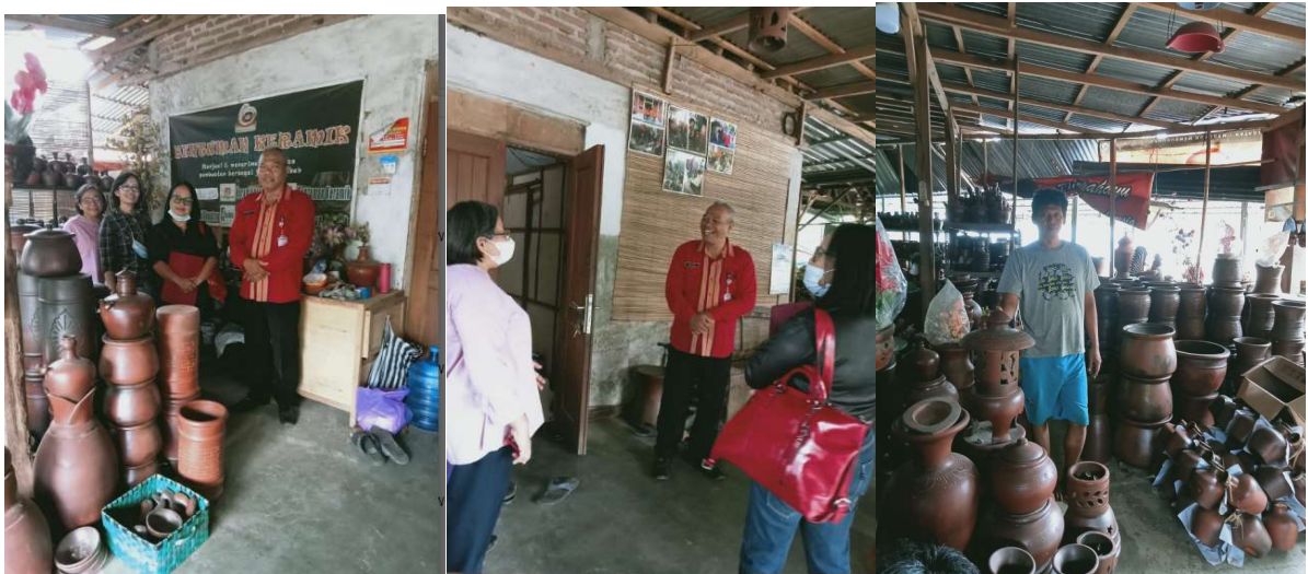
Gambar 1. Kegiatan awal pelaksanaan PkM

Kegiatan pelatihan Pemanfaatan platform digital seperti Gaway Android untuk penjualan gerabah di Tokopedia dan Shopee sangatlah penting bagi UMKM Pagerjuran karena ini membuka peluang besar untuk mengembangkan bisnis mereka, dilihat pada gambar 1.