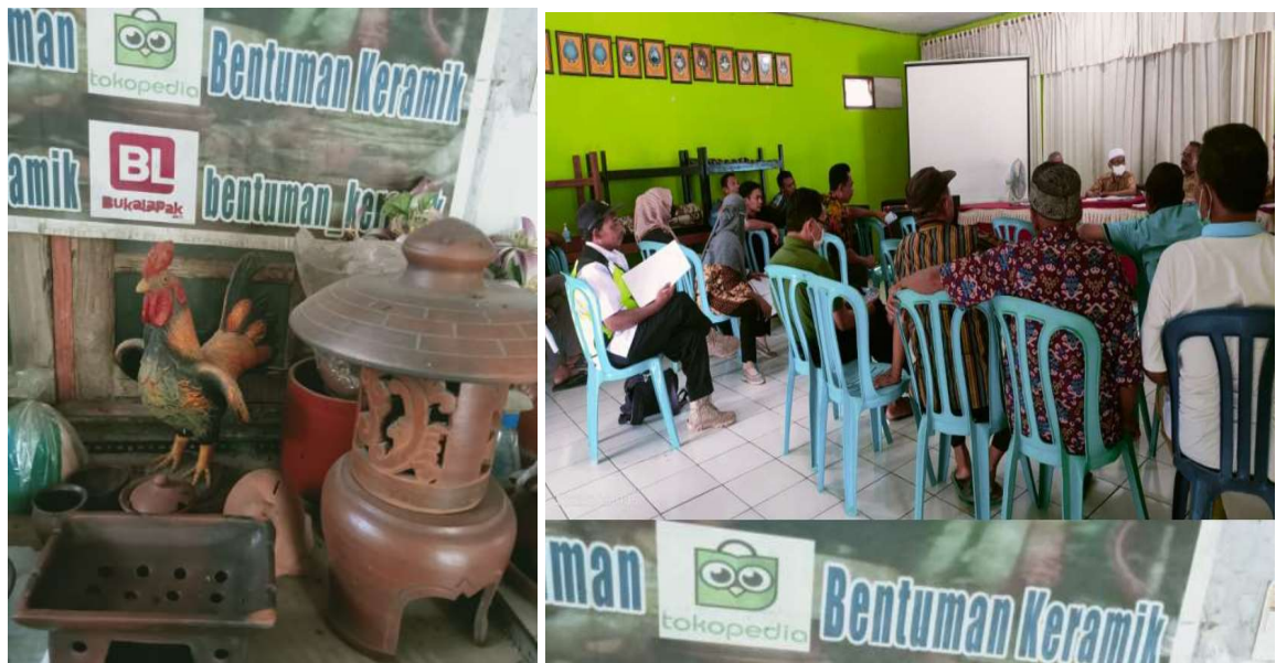
Gambar 2. Gambaran metode pelaksanaan PkM

Metode ini menggabungkan pendekatan pelatihan, pendampingan, dan implementasi praktik terbaik dalam penjualan online. Gambaran metode pelaksanaan PkM dapat dilihat pada gambar 2.