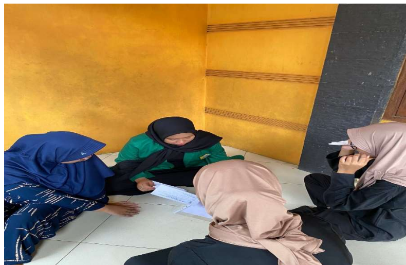
Gambar 1. Surat Kerja Sama

Pada pelaksanaan pengabdian masyarakat ini saya bekerja sama dengan teman saya yang bernama Anala ilfi xena andini di suatu desa yang sama, dan juga kami bekerja sama dengan rekan rekanita ranting magersari. Tetapi kami berdua memiliki proker yang berbeda. Yang mana teman saya Anala mengusung judul tentang bank minyak goreng bekas sedangkan saya mengusungkan judul pemanfaatan sampah daur ulang guna menambah pendapatan masyarakat warga didesa magersari.