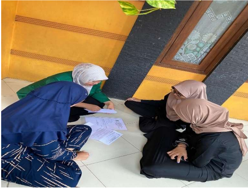
Gambar 1. Mengajukan Surat Kerjasama

Dari Kegiatan ini hasilnya menunjukkan peningkatan yang signifikan dalam kesadaran warga, masyarakat maupun anak-anak IPPNU mengenai dampak lingkungan dari botol plastik.