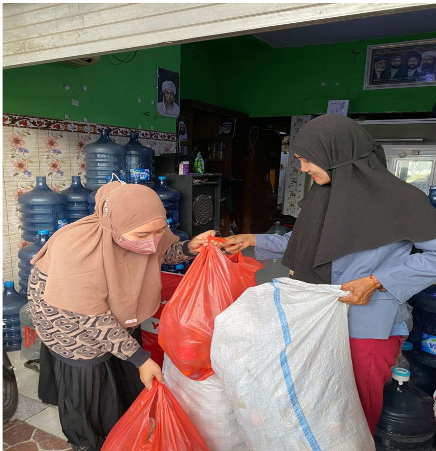
Gambar 3. Mengumpulkan Sampah Botol Plastik

Botol bekas air mineral adalah sampah berbahan plastik yang bisa didaur ulang oleh karena itu memiliki nilai jual yang cukup menghasilkan bagi para pemulung. Botol bekas air mineral bagi