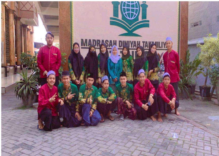
Gambar 2. Penyampaian Tentang Botol Plastik