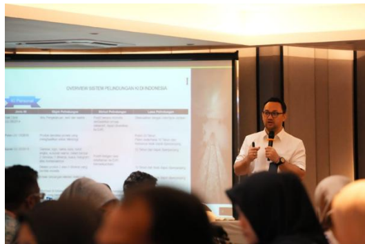
Gambar 3. Lanjutan Overview Reorientasi Perlindungan KI.

Perlindungan KI terdiri atas berbagai rezim, seperti hak cipta, paten, merek, desain industri, rahasia dagang, desain tata letak sirkuit terpadu, dan perlindungan varietas tanaman yang masing-masing memiliki objek, mekanisme, dan jangka waktu perlindungan berbeda. Hak cipta menganut prinsip deklaratif, sedangkan paten, merek, dan desain industri memperoleh perlindungan melalui mekanisme pendaftaran pada Direktorat Jenderal Kekayaan Intelektual (DJKI). Keberagaman rezim tersebut menunjukkan bahwa perlindungan KI memerlukan pendekatan yang adaptif sesuai karakter inovasi yang dihasilkan (Haris Munandar&Sitanggang, 2011).