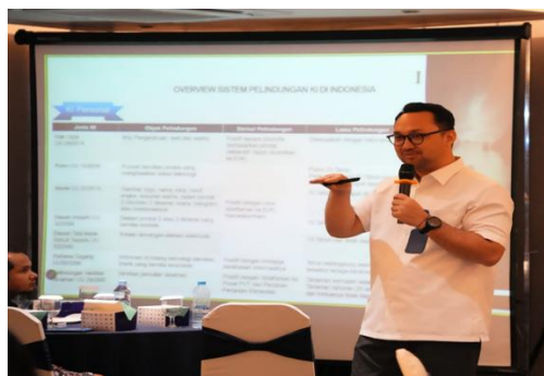
Gambar 2. Overview Perlindungan KI di Indonesia.

Di samping itu, pendekatan administratif juga memengaruhi fungsi sentra KI di perguruan tinggi yang belum berjalan secara optimal. Sebagian besar sentra KI masih berorientasi pada layanan teknis pendaftaran KI dan belum berkembang menjadi pusat transfer teknologi yang mampu menjembatani hasil penelitian dengan kebutuhan industri maupun masyarakat. Akibatnya, inovasi yang dihasilkan perguruan tinggi lebih banyak berhenti pada publikasi akademik dan belum memberikan kontribusi ekonomi secara nyata (Margono, 2010).