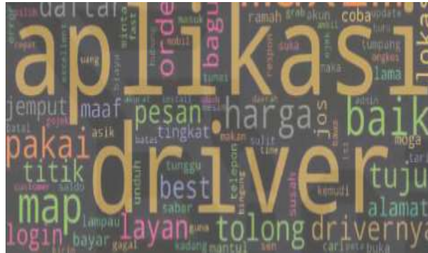
Gambar 10. Wordcloud Sentimen Netral

Kata-kata yang mendominasi sentimen netral pengguna aplikasi redBus sebagai representasi pengguna Access by Bus Kota di seluruh Indonesia antara lain adalah kata-kata aplikasi; pengemudi; puas; peta; daftar; bagus; pesanan; pengemudi; dan harga. Visualisasi kata-kata pada data ulasan sentimen negatif ditunjukkan pada Gambar 10.