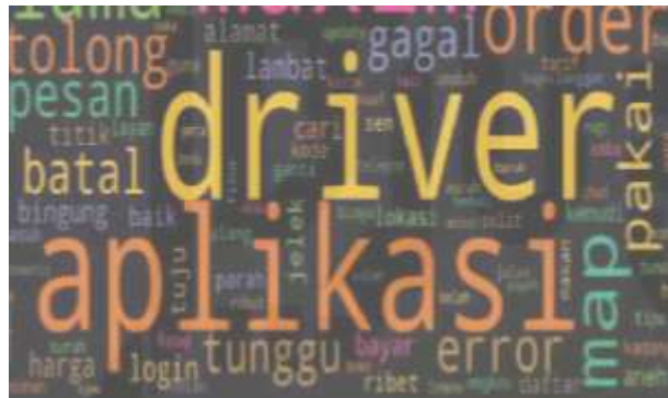
Gambar 11. Wordcloud Sentimen Negatif

Kata-kata yang mendominasi sentimen netral pengguna aplikasi redBus sebagai representasi pengguna Access by Bus Kota di seluruh Indonesia antara lain adalah kata-kata aplikasi; pengemudi; puas; peta; daftar; bagus; pesanan; pengemudi; dan harga. Visualisasi kata-kata pada data ulasan sentimen negatif ditunjukkan pada Gambar 10.