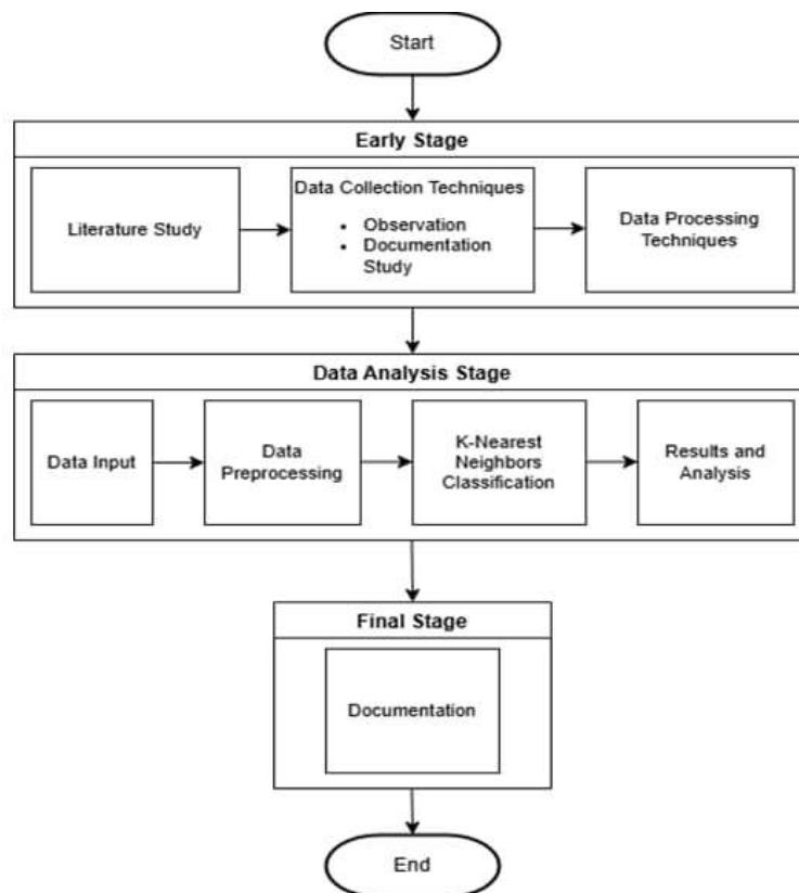
Gambar 1. Diagram Alir Penelitian

tertulis yang mendasari penelitian agar dapat menyelesaikan permasalahan dan dijadikan acuan yang kuat dalam melakukan analisis. Pengolahan data diawali dengan (a) Tahap praproses data; (b) Pembagian data latih dan data uji; (c) Pemodelan klasifikasi data dengan K-NN; dan (d) Analisis sentimen hasil klasifikasi. Tahapan praproses data review terdiri dari case folding, tokenizing, cleansing, stopwords removal, stemming, pelabelan data review, dan diakhiri dengan proses pembobotan TF-IDF. Setelah data dipraproses, dilakukan proses distribusi data latih dan data uji dengan besaran yang bervariasi, kemudian dilakukan pemodelan data dengan KNN menggunakan beberapa nilai parameter k. Data yang digunakan adalah data yang diperoleh dari ulasan pengguna aplikasi redBus selama satu bulan terhitung dari tanggal 20 September 2024 sampai dengan 20 Oktober 2024 dengan total 1291 ulasan. Data ulasan pengguna aplikasi redBus diperoleh dari Google Play Store yang dapat diakses melalui tautan https://play.google.com/store/apps/details?id=in.redbus.android&hl=id&pli=1 dengan menggunakan teknik scraping melalui bahasa pemrograman Python. Proses scraping data ulasan menggunakan Package google_play_scraper yang tersedia dalam bahasa python.