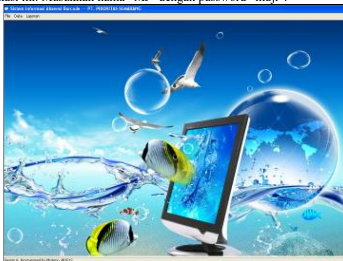
Gambar 4 Tampilan Halaman Administrator

Form login muncul ketika akan masuk ke menu administrator yang dimaksudkan untuk membatasi petugas yang memakai aplikasi ini. Masukkan nama “MJ” dengan password “muji”.