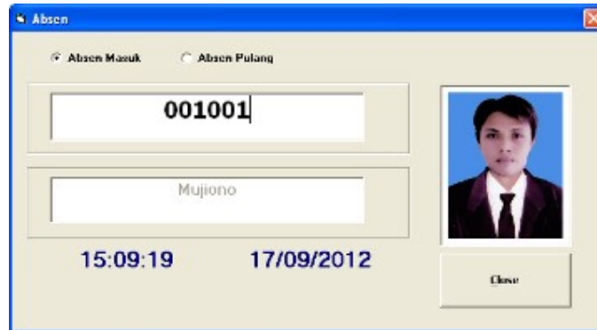
Gambar 2 Tampilan Form Absensi

Untuk memulai absensi harus memilih dulu option “Absen Masuk” atau “Absen Pulang” , kemudian tembakkan alat barcode ke arah kartu absensi. Jika NIK dikenal akan muncul gambar foto karyawan yang sudah disimpan dalam database. Proses ini akan langsung menyimpan informasi absensi yang telah dilakukan sesuai tanggal dan jam.