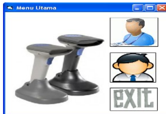
Gambar 1 Tampilan Menu Utama

Tampilan gambar di atas terlihat pada saat pertama kali aplikasi dijalankan. Ada 3 pilihan gambar yang bisa dipilih yaitu :