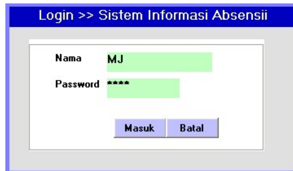
Gambar 3 Tampilan Form Login

Untuk memulai absensi harus memilih dulu option “Absen Masuk” atau “Absen Pulang” , kemudian tembakkan alat barcode ke arah kartu absensi. Jika NIK dikenal akan muncul gambar foto karyawan yang sudah disimpan dalam database. Proses ini akan langsung menyimpan informasi absensi yang telah dilakukan sesuai tanggal dan jam.