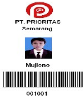
Gambar 8 Kartu Absensi Karyawan