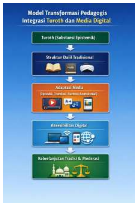
Gambar 2. Model Transformasi Pedagogis Integrasi Turoth dan Media Digital.

Lebih jauh, integrasi ini juga menunjukkan bahwa otoritas keilmuan tidak sepenuhnya digantikan oleh logika popularitas digital. Dalam banyak kasus, legitimasi di media sosial dibangun melalui viralitas dan jumlah pengikut (Wibowo & Triadi, 2025). Namun dalam kajian yang dianalisis, legitimasi tetap bertumpu pada kitab dan mazhab. Dengan kata lain, digitalisasi tidak menggeser fondasi epistemologis, melainkan memperluas ruang transmisinya. Secara konseptual, proses integrasi ini dapat divisualisasikan dalam model berikut: