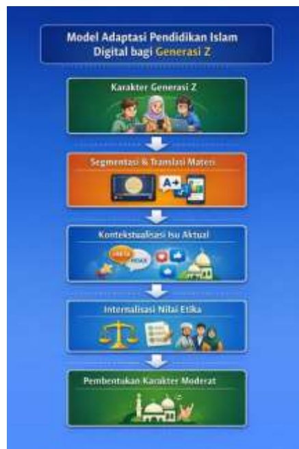
Gambar 3. Model Adaptasi Pendidikan Islam Digital bagi Generasi Z.

Secara konseptual, adaptasi pedagogis ini dapat divisualisasikan dalam model berikut: