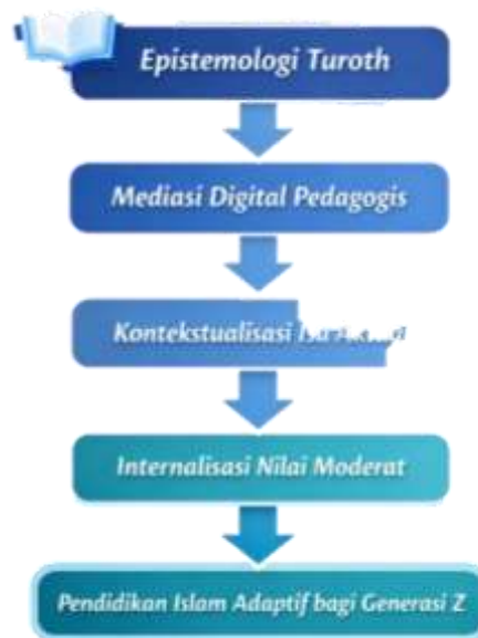
Gambar 6. Model Pendidikan Islam.

Ketiga dimensi tersebut membentuk suatu model pendidikan Islam digital berbasis turoth yang dapat dipahami sebagai berikut: