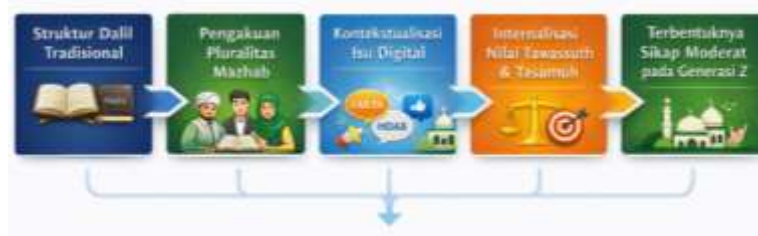
Gambar 5. Model Konstruksi Pendidikan Islam Moderat.

Tabel tersebut menunjukkan bahwa moderasi dibangun melalui penerapan prinsip klasik pada konteks aktual. Proses konstruksi pendidikan Islam moderat dalam penelitian ini dapat divisualisasikan sebagai berikut: